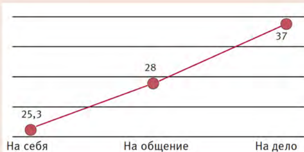
Рис. 2. Структура направленности личности медсестер, в баллах

своих знакомств, отстаивают свое мнение, планируют свою работу, однако потенциал их склонностей не отличается высокой устойчивостью. Эта группа испытуемых нуждается в дальнейшей серьезной и планомерной воспитательной работе по формированию и развитию коммуникативных и организаторских способностей.