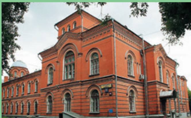
Никольская община сестер милосердия

История народов России показывает, что в их культуре еще в период родоплеменных отношений стали складываться традиции гуманного, сострадательного отношения к немощным и обездоленным людям, особенно к детям и старикам как к наиболее беззащитным и уязвимым членам общества. Благотворительность в нашей стране в той или иной форме существовала уже в древнейшие времена, а в нравственный принцип как форма помощи имущего неимущему, проявление сострадания к ближнему была возведена христианством.