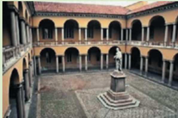
Университет Болоньи (Alma Mater Studiorum Universita di Bologna, UNIBO) – один из самых старых в мире непрерывно действующих университетов, предоставляющих академическую степень; второй по величине университет Италии

Сегодня мы наблюдаем кризис мировой системы образования, связанный с тем, что заканчивается индустриальный этап развития цивилизации, для которого характерны непосредственная включен-