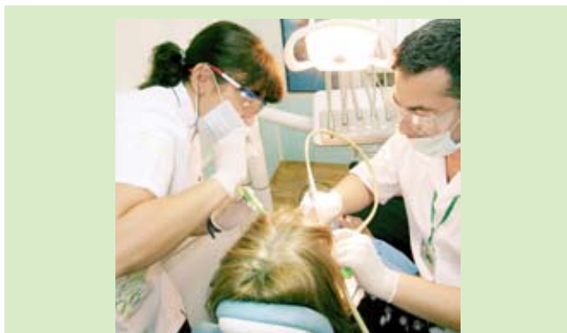
Вынужденная рабочая поза. Ассистент врача-стоматолога находится в вынужденной позе со статической нагрузкой на многие группы мышц

Нами проведен опрос медсестер, работающих ассистентами врача-стоматолога по технологии «в четыре руки» (30 человек), и медсестер, работающих по обычной технологии (30 человек) – табл. 1,2. Опрос проводился методом анонимного анкетирования. Респондентам задавали 43 вопроса, касающихся социального статуса, уровня квалификации, уровня образования, здоровья, условий работы.