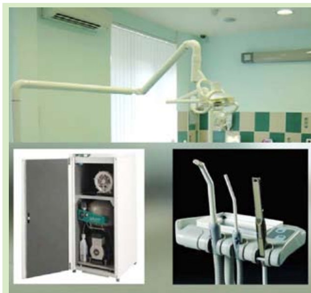
Общая и местная вибрация. Колебательные движения какого-либо тела

Труд ассистента врача-стоматолога характеризуется как напряженный, умственно-эмоциональный, сопряженный с выраженной статической нагрузкой (Классификация труда по тяжести и напряженности, предложенная Институтом гигиены труда и профзаболеваний АМН СССР).