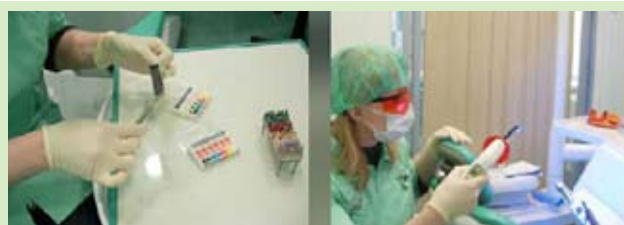
Зрительное перенапряжение. Астенопия – чувство утомления глаз