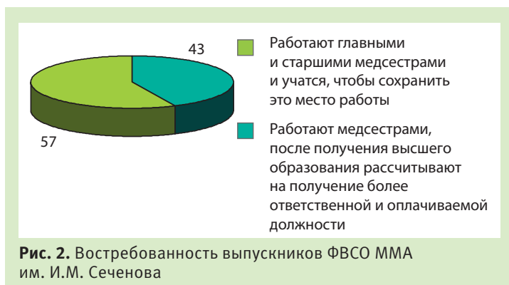
Рис. 2. Востребованность выпускников ФВСО ММА им. И.М. Сеченова