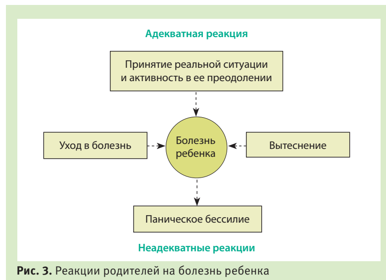
Рис. 3. Реакции родителей на болезнь ребенка

3. Низкий уровень собственного здоровья многих родителей, их частые болезни, переживания, связанные с тяжелыми недугами близких. В этой ситуации родители часто переносят тревогу за свое благополучие и жизнь на ребенка. Кроме того, они не-