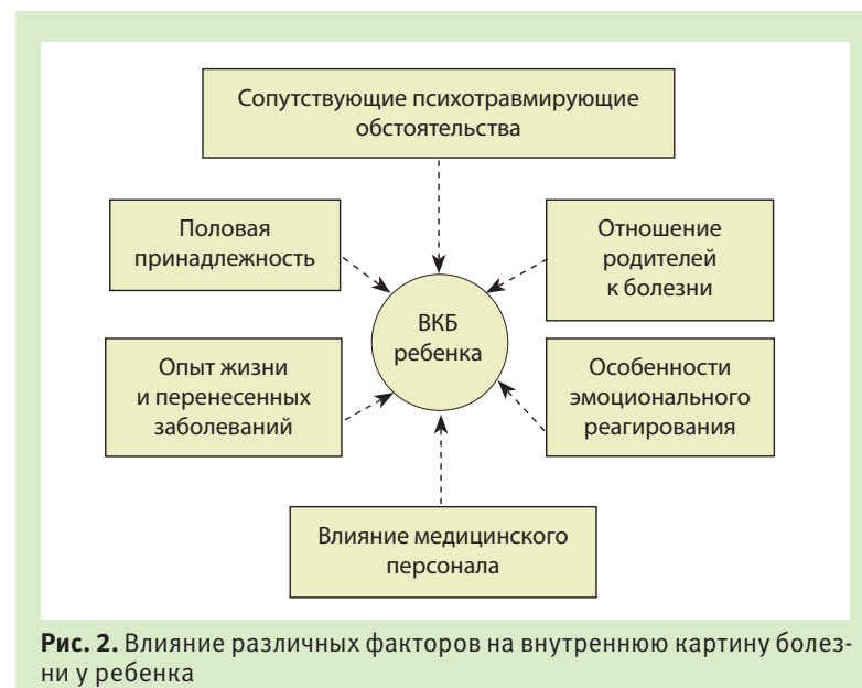
Рис. 2. Влияние различных факторов на внутреннюю картину болезни у ребенка

Особенности эмоционального реагирования. У детей как с преморбидными, так и с развивающимися в процессе болезни тревожными, истероидными и другими чертами личности, с эмоциональной лабильностью или эксплозивностью формируются те или иные преобладающие эмоции, мотивации и направленность интересов, которые определяют ВКБ.